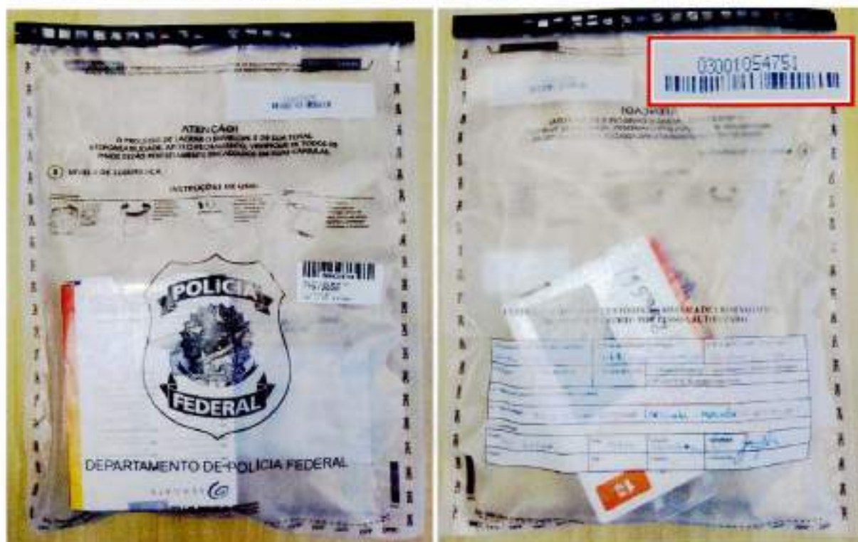
Figura 1: Material questionado acondicionado em envelope de segurança padrão PF nº 03001054751 . Frente (esquerda) e verso(direita).

Criminalística como Material Nº 779/2020 – INC/DITEC/PF , da marca SEAGATE , modelo EXPANSION , número de série NA88DDP3 , patrimônio da Presidência da Republica nº 195.1992 . O material é apresentado nas Figuras 1 e 2.